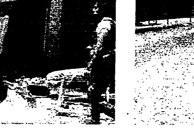
شوارع مظرة في ظل الحرب